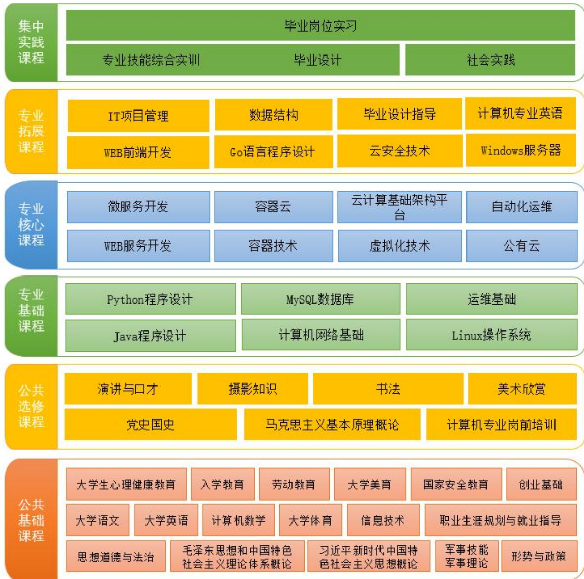
图 2 课程体系

律和认知学习规律，设计课程体系。全面贯彻“三全育人”改革实施方案，把立德树人融入思想道德教育、文化知识教育、技术技能培养、社会实践教育各环节。